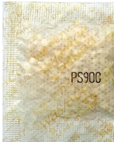
・ 模倣品パッケージ

弊社が代理店として販売しておりますレンゴー社の防カビ剤「ワサエース® WASAACE®」の模倣品が、最近中国国内で流通していることを確認しております。