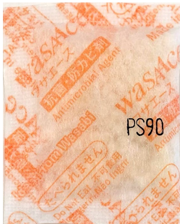
・ 正規品パッケージ(90日タイプ)